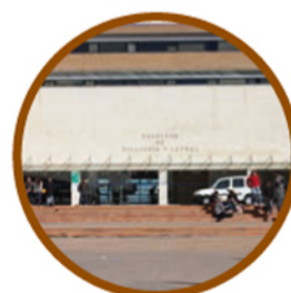
13. FACULTAD DE FILOSOFÍA Y LETRAS Entidad Bancaria (Carnet Universitario)