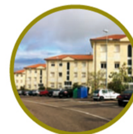
17. APARTAMENTOS UNIVERSITARIOS