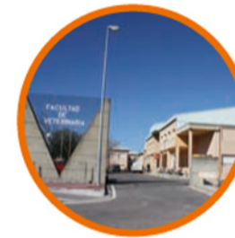
7. FACULTAD DE VETERINARIA