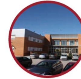
6. ESCUELA DE ENFERMERÍA Y TERAPIA OCUPACIONAL