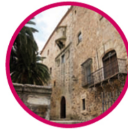
3. Palacio de la generala Servicios Administrativos