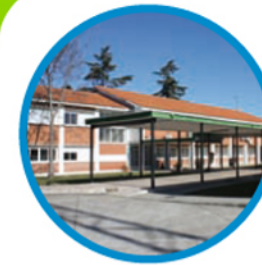
5. FACULTAD DE ESTUDIOS EMPRESARIALES Y TURISMO