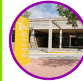
10. Escuela POLITÉCNICA