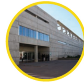
12. BIBLIOTECA CENTRAL