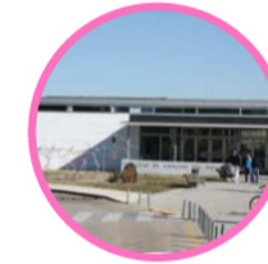
16. FACULTAD DE CIENCIAS DEL DEPORTE