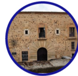
4. EDIFICIO RECTORADO Secretariado de Actividades Culturales