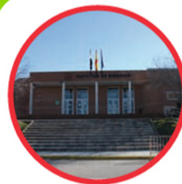
11. FACULTAD DE DERECHO