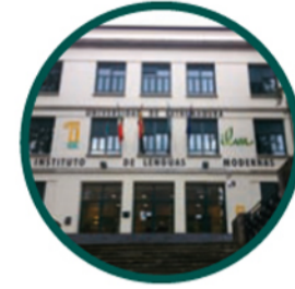
2. INSTITUTO DE Lenguas Modernas