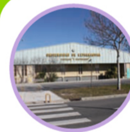
15. SERVICIO DE ACTIVIDAD FÍSICA Y DEPORTE (SAFYDE)