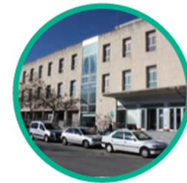
14. FACULTAD DE FORMACIÓN DEL PROFESORADO